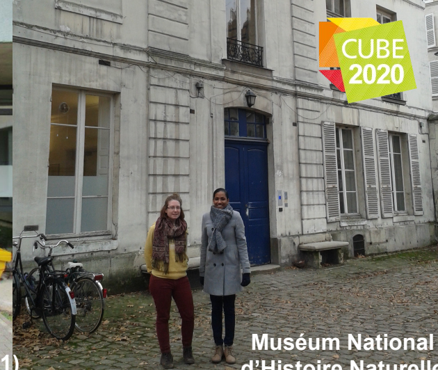
Muséum National d'Histoire Naturelle