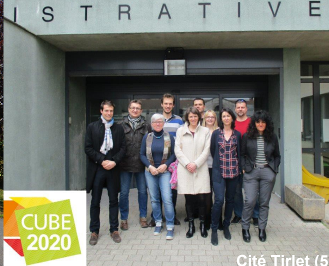
Cité Tirlet (51)